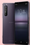
SONY Xperia 1 II

● 適用對象：彰化縣政府及轄下機關員工、員眷、其他申辦資格請洽專員0934287668