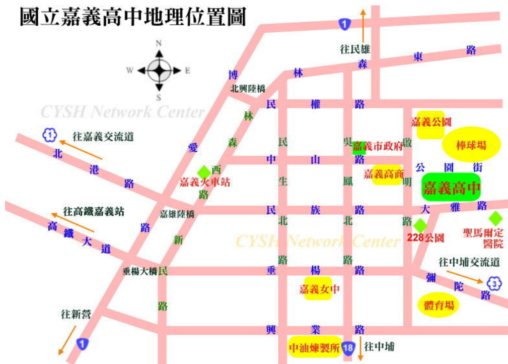
國立嘉義高中地理位置圖