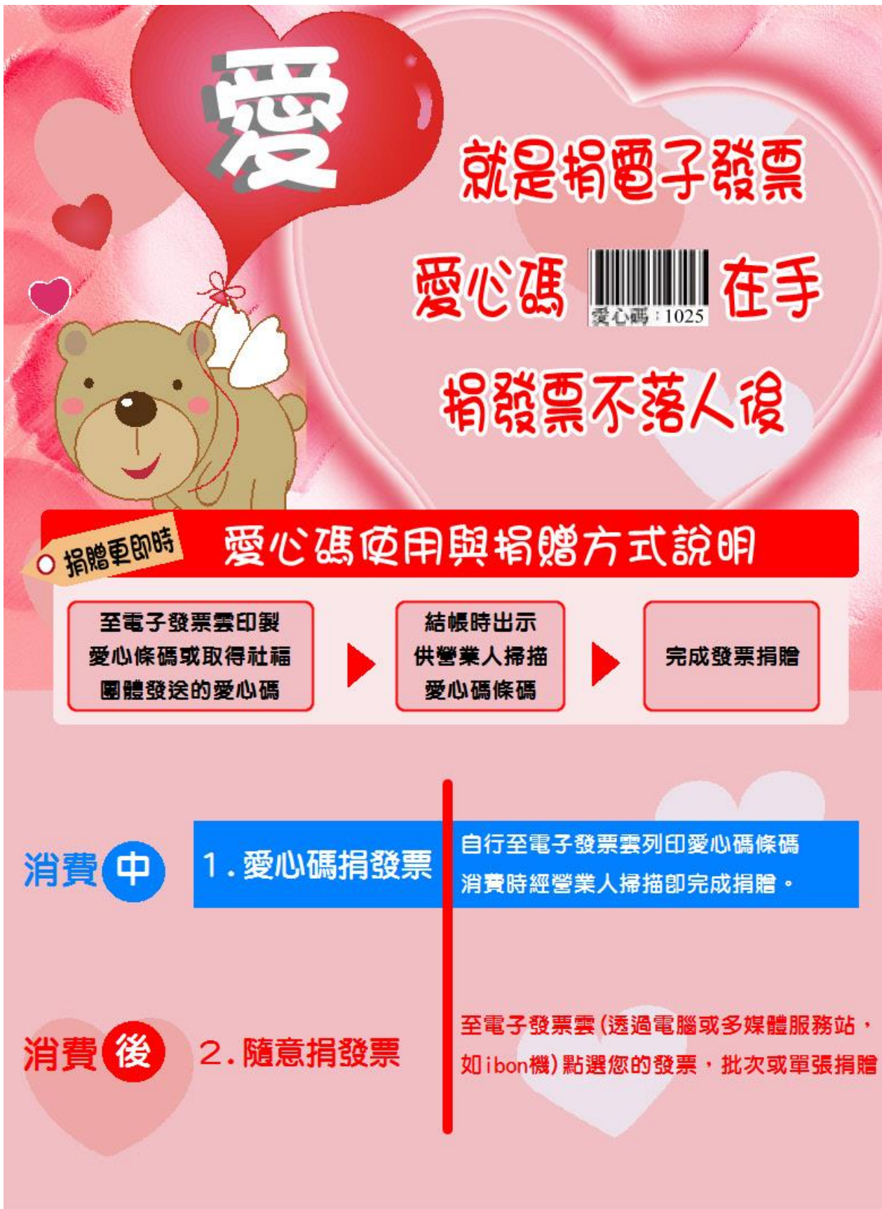
圖 4：愛心碼捐贈流程